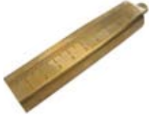
Doluluk ölçüm iskandili