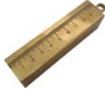
Boşluk ölçüm iskandili